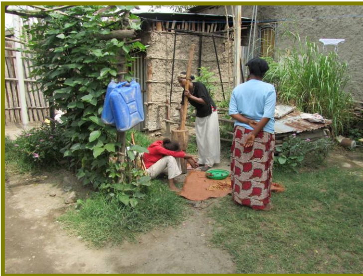
In Hawassa viel wel veel regen en is alles nog mooi groen.

De echte droogteproblemen doen zich in het grensgebied met Somalië. In dit lagere deel van het land is de droogte echt zichtbaar: toen we naar het grensgebied reisden, werd het na