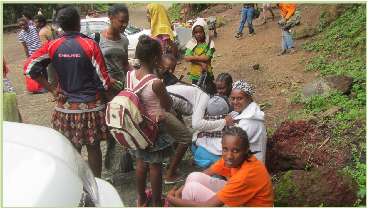
Uitje naar Wendo Genet

Stichting Chale – stichtingchale@solcon.nl – 055 5224620 – IBAN: NL12RABO0150823878 www.chale.nl – www.facebook.com/StichtingChale - Arnhemseweg 71, 7331 BC APELDOORN