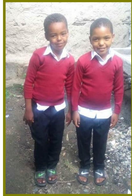
Kinderen in hun nieuwe schooluniform.