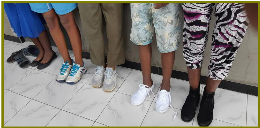
Juni 2018: Vier tieners uit ons project met hun 'nieuwe' schoenen (en kleding).

Als iemand uit Nederland ons project bezoekt in Hawassa, vragen we om nuttige spullen mee te nemen voor de vele kinderen die we helpen. Een groot deel van de kinderen die we helpen groeien jaarlijks uit hun kleren en kunnen eigenlijk elk jaar wel nieuwe schoenen en kleren gebruiken. De ouders/verzorgers van de kinderen hebben daar vaak maar heel beperkt of gewoon geen geld voor.