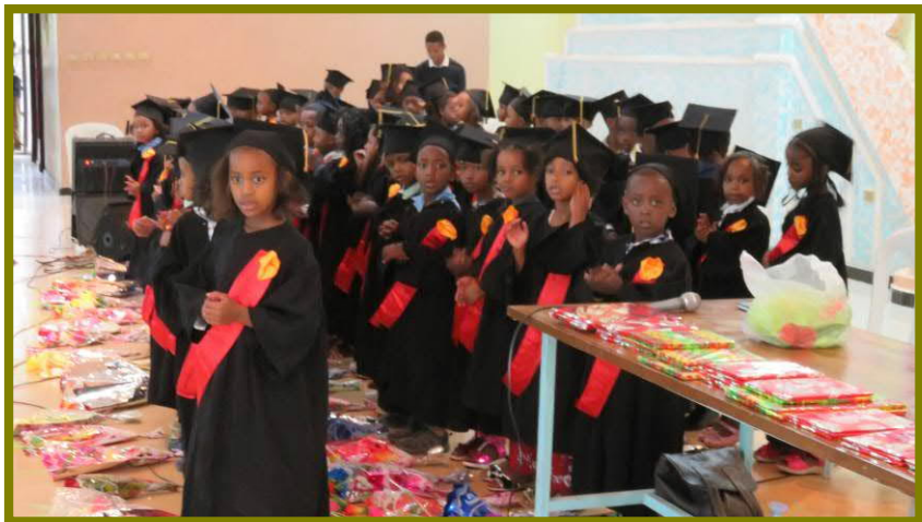
'Graduation' (diploma-uitreiking op onze partner-school 'Kaliwot') – juli 2018

Niettemin zijn er nog steeds veel gezinnen die om verschillende redenen niet kunnen profiteren van de groeiende economie en niet op eigen kracht uit hun situatie van diepe armoede kunnen komen. Vaak gaat het dan om weeskinderen en eenoudergezinnen. In het deel van de stad waar stichting Chale vooral actief is, werken we o.a. samen met de christelijke Kaliwot school om kinderen uit deze kwetsbare gezinnen goed onderwijs te geven. Samen met een andere hulporganisatie proberen we de school te helpen de bovenbouw sterker te maken, zodat kinderen uit de buurt langer in eigen omgeving goed onderwijs kunnen krijgen.