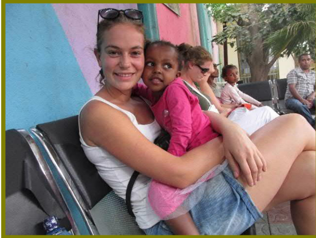
Op bezoek bij een van de scholen waar stichting Chale mee samen werkt

Wat mij zo aansprak, is het feit dat alle kinderen die gesponsord worden, meerdere keren per jaar een huisbezoek vanuit de stichting krijgen. Vervolgens wordt je als sponsor op de hoogte gebracht van het huisbezoek: Hoe zijn de omstandigheden van 'jouw kind', ziet hij of zij er goed uit, hoe is de hygiëne, is er een bed? Maar ook het schoolrapport waarop je kunt zien hoe je sponsorkind het doet op school en hoe vaak hij of zij afwezig is geweest in het afgelopen schooljaar. Heel transparant, daarnaast heb je écht het gevoel dat je er als sponsor bij betrokken wordt en besef je je des te meer dat je hulp gewaardeerd wordt.