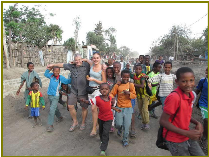
Op straat in Hawassa

Hawassa... wat een bijzondere plek. Ik voelde me er direct op mijn gemak. Er is veel te zien op straat: ezels met karren vol spullen, geiten, schoenenpoetsers, winkeltjes in etenswaren (broodjes, bananen), markten en nog veel meer. Als ik eraan denk dan hoor en ruik ik de straten weer. Iedereen is er op straat en iedereen kijkt me natuurlijk aan. Wit. Waar gaat die witte mevrouw heen, wat heeft ze meegenomen? Als je er een uur op straat loopt, hebben minstens 20 kinderen achter je aangelopen. Soms twee giechelende meisjes, soms een luidruchtige groep jongens. Maar altijd vermakelijk en nooit vervelend. Ze willen vaak gewoon even je hand vasthouden en met je meelopen.