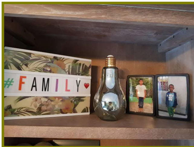
Foto's van onze sponsorkinderen in de woonkamer