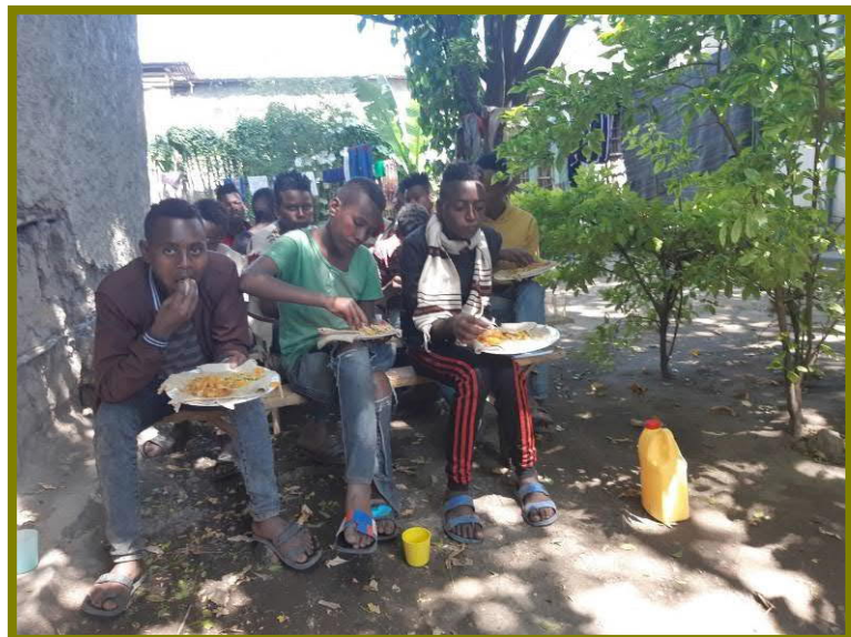
Lunch voordat de training begint

Voor de vierde keer is onze lokale partner Tilahunen foundation een training gestart voor straatkinderen, allemaal jongens dit keer. Een groep van 16 jongens is in november met elkaar begonnen om onder leiding van onze trainers. Ze worden op de eerste plaats geschoold in omgangsvormen en handelsvaardigheden, maar krijgen ook persoonlijke begeleiding. Elke trainingsdag beginnen ze met een lunch. Doel is dat ze na een aantal weken training en begeleiding starten met een eigen