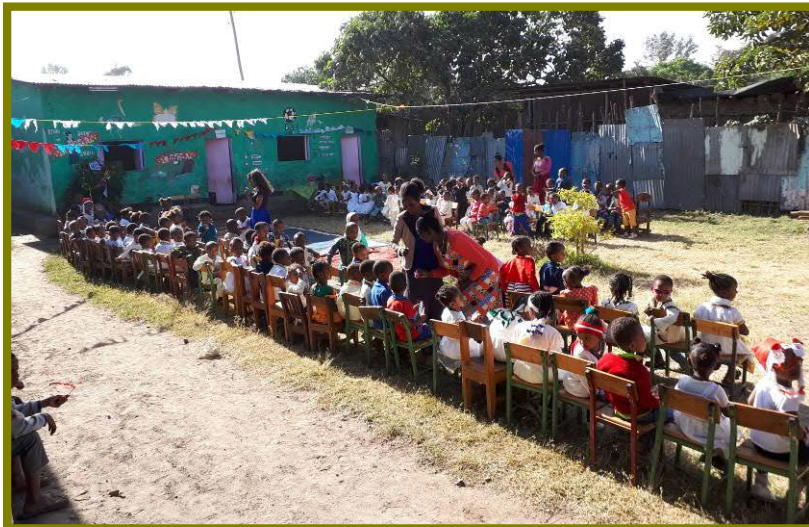
Kerstviering op Silenat 2018 (in Ethiopië vieren ze kerst op 7 januari)