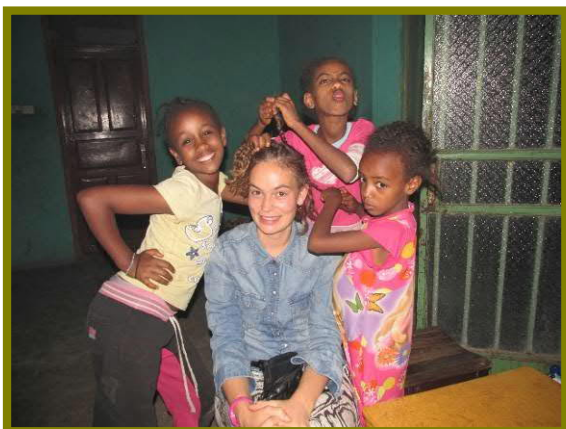
Op bezoek bij een aantal kinderen van stichting Chale