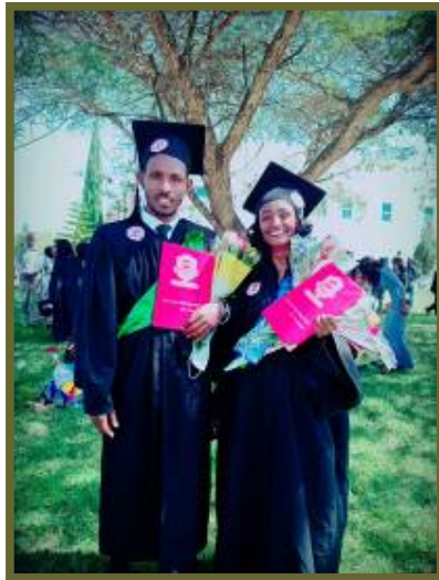
Getawork en Meskerem

Ook in het onderwijs was er een grote impact te zien door de lockdown. Van maart tot oktober zijn de scholen praktisch dicht geweest en moesten kinderen thuis leren. Doordat de meeste kinderen in het land amper of geen toegang hebben tot internet is er veel achterstand opgelopen. Afgelopen schooljaar is iedereen (behalve grade 8 en grade 12, waar examens wordt gedaan) overgegaan. We verwachten dat dit jaar relatief veel kinderen zullen blijven zitten.